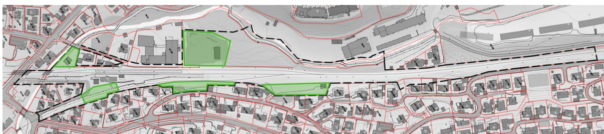
Figur 1 Kartskisse som viser varslingsområdet (stiplet) og mulige rigg- og anleggsområder i grønt

Det vurderes inntil videre at riggområder til prosjektet i hovedsak kan holdes innenfor Bane NOR sitt eget areal og derved ikke vil kreve permanent beslag på arealer for omkringliggende eiendommer. Det må gjennom reguleringsplanarbeidet sikres grunnlag for midlertidig atkomst til riggområdene. Av figur 1 kan en se den mulige plasseringen av riggområdene.